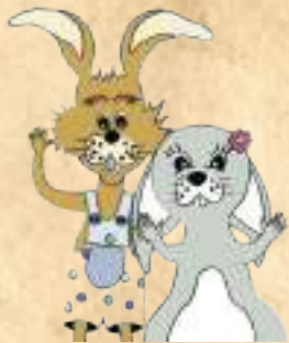
Waldi & Bella