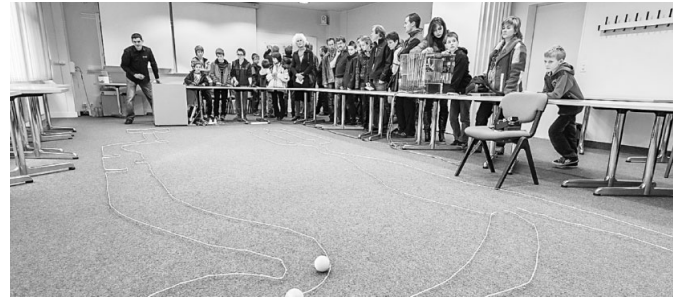
Faszinierende Technik. Die HES-SO Wallis zeigt sich am Samstag dem Publikum.

Die Besucher können im Simulator auch ein Erdbeben